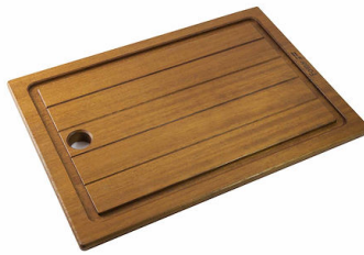
Tabla de corte de madera Iroko 8643 117