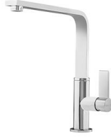
Monomando NYC 8486 000